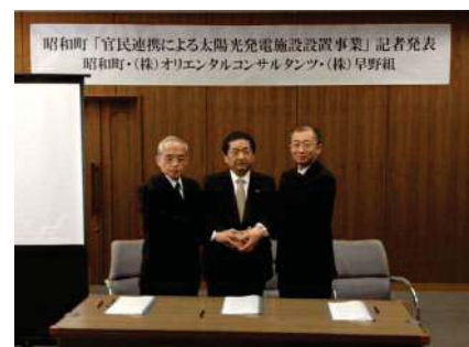
本日、昭和町にて記者発表会を実施