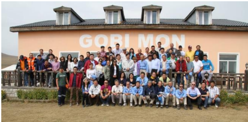
プロジェクトチーム一同（現場事務所の近くにて）