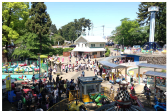
ゴールデンウィークの様子 【前橋市中央児童遊園 (るなぱあく)】 (平成27年5月)

＜本資料に関するお問い合わせ先＞ 株式会社オリエンタルコンサルタンツ TEL: 03-6311-7551 FAX: 03-6311-8011 URL: http://www.oriconsul.com/ 統括本部 藪内、伊藤