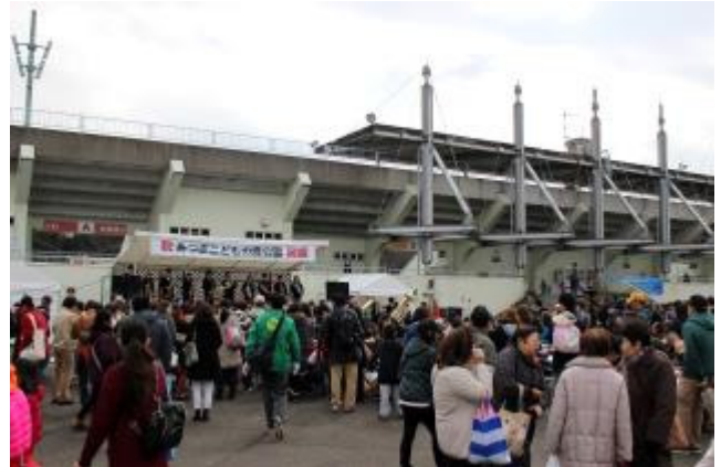
あつぎこどもの森公園オープニングイベントの様子 【厚木市萩野運動公園】 (平成28年3月)