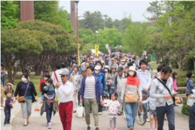
第26回敷島公園まつりの様子 【群馬県立敷島公園】 (平成27年4月)