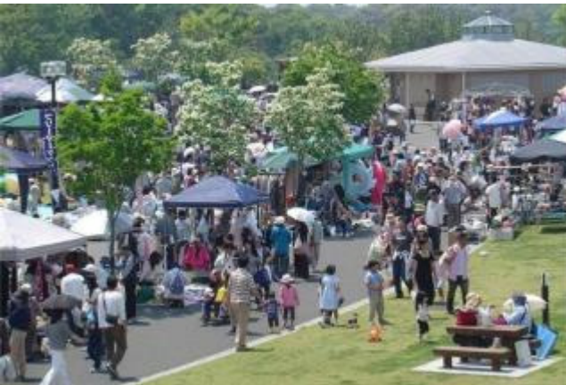
みつばちフリーマーケットの様子 【北九州市響灘緑地 (GREEN PARK)】 (平成27年7月)