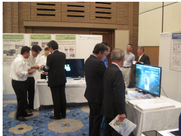
同社の出展ブース