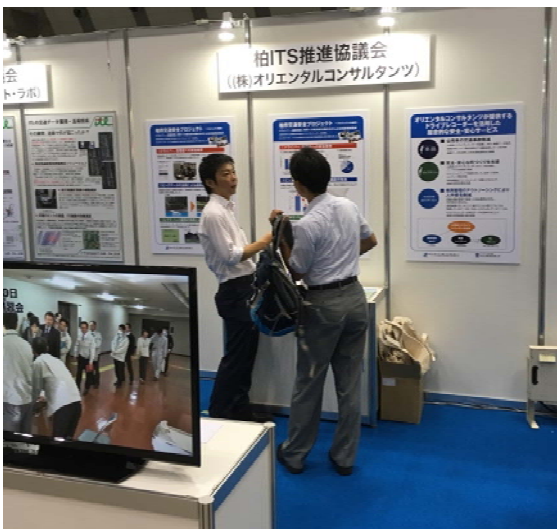
同社の出展ブース

名 称 : ITS テクノロジー展 主 催 : フジサンケイ ビジネスアイ（日本工業新聞社） 開 催 日 : 平成28年9月28日（水）～30日（金） 会 場 : 東京ビッグサイト〔東京国際展示場〕東ホール 〒135-0063 東京都江東区有明3-11-1