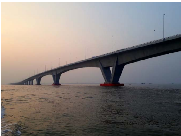
ディンブー—カットハイ橋

http://www.jpcci.or.jp/download/soukai-59/59-37-38.pdf