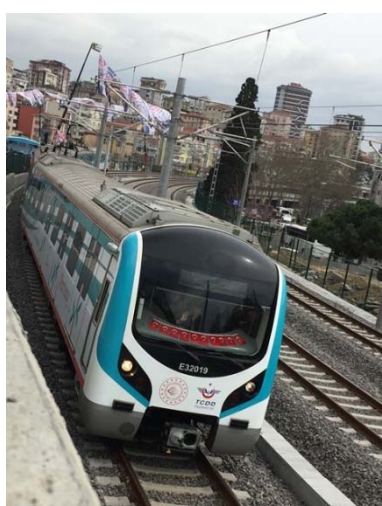
全面開通後の一番列車