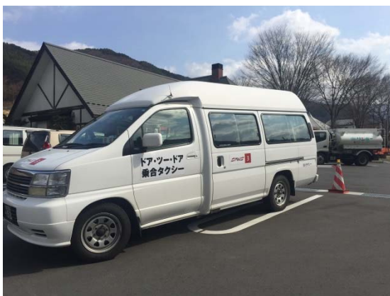
サービスを実施したタクシー

同社は、実証実験の運行状況や利用者アンケート結果から、導入する際の課題、求められるサービスレベルを把握し、自治体と連携し、地域に導入できる仕組みを構築していきたいと考えています。今後は、変化する社会に応じて、中山間地域も含めた交通まちづくりを先導的に推進し、総合的な地域活性化に貢献してまいります。