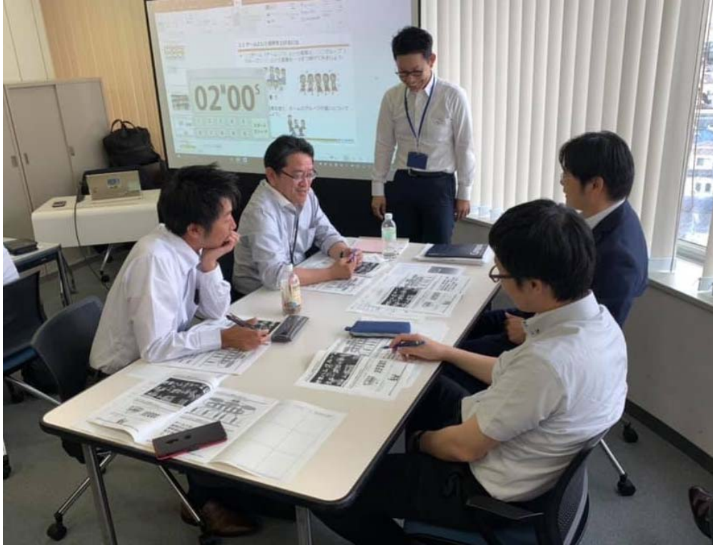
【チームマネジメント研修の様子】