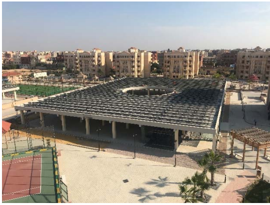
プラザ棟に設置された太陽光パネル