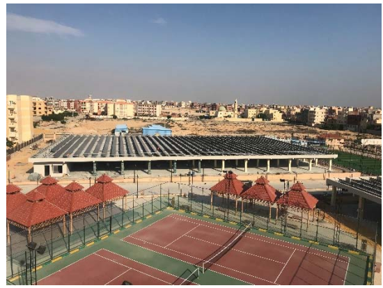
パーキング棟に設置された太陽光パネル