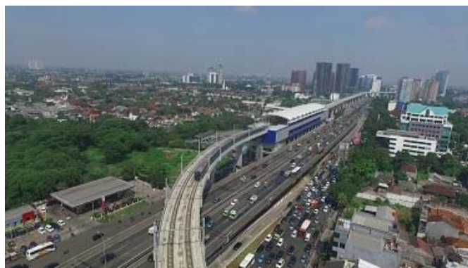
ファトマワテイ高架駅と長大橋

本資料に関するお問い合わせ先> 株式会社オリエタルコンサルタンツグローバル TEL: 03-6311-7570 FAX: 03-6311-8020 URL: https://ocglobal.jp/ 担当 広報室 菅原史緒