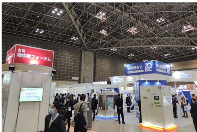
当日の会場の様子