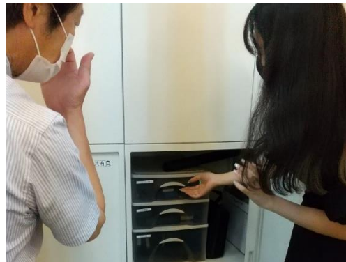
■安全5Sパトロールの様子