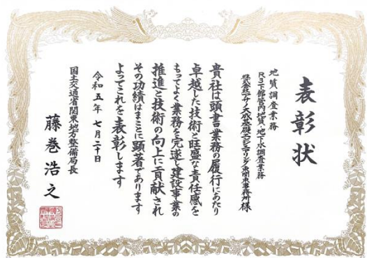
表彰状（局長優良業務表彰）

今後も同社は、顧客や関係者と連携を強化し、高い期待に応える土木・建築分野の総合エンジニアリング企業として、邁進してまいります。