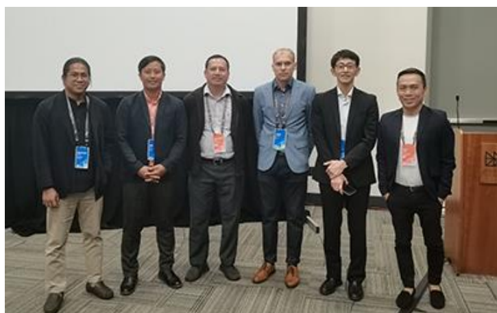
関係者との記念撮影