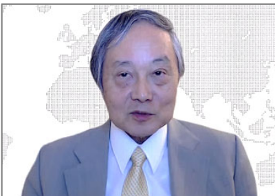
開会挨拶：市川宏雄 日本危機管理防災学会会長