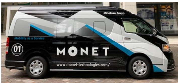
< 外観 >

サービスに合わせて車室内のレイアウトを自在に設定できる車両を、医療 MaaS 向けに利用します。 詳細はこちら ( https://www.monet-technologies.com/product/maasconversion_mtv ) をご覧ください。