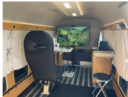
< 内観 >