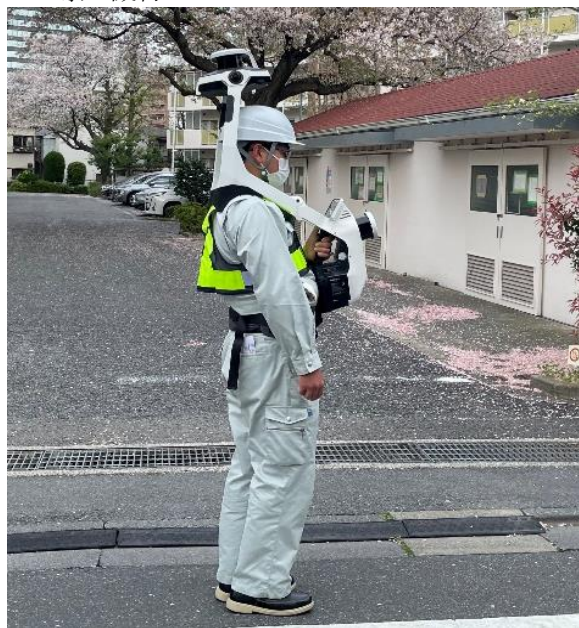
■導入機材 NavVis VLX3