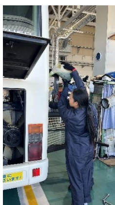
<クーラント液注水>