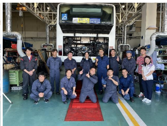
<参加者一同（中央：女子生徒）>