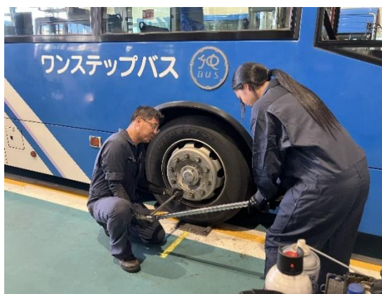
<タイヤ交換（取り外し）>