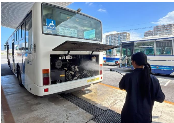
<バスのエンジン部の清掃>