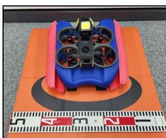
③360° カメラ搭載 水上ミニドローン (溝橋・暗所等撮影)