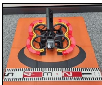
②360° カメラ搭載 ミニドローン (鋼橋主桁間等撮影)