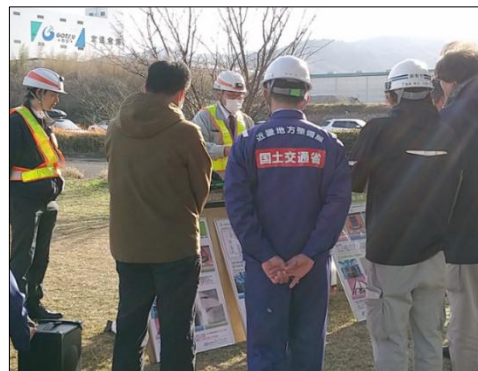
【最新ドローン技術を紹介する同社社員】