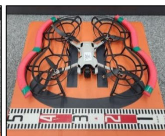
④高画質カメラ搭載 壁面ミニドローン (下部工・壁面等撮影)