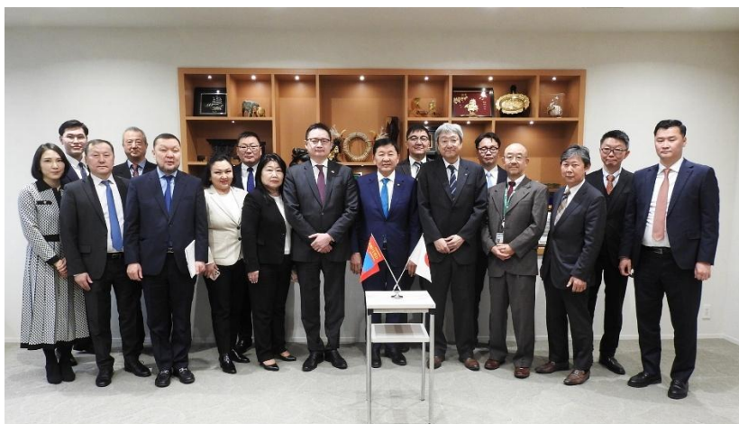
会談後の記念撮影

OC Global は現在『モンゴル国チンギスハーン国際空港拡張事業準備調査』を実施しており、今回の会談では、同空港の拡張事業および空港アクセス鉄道事業について意見交換しました。