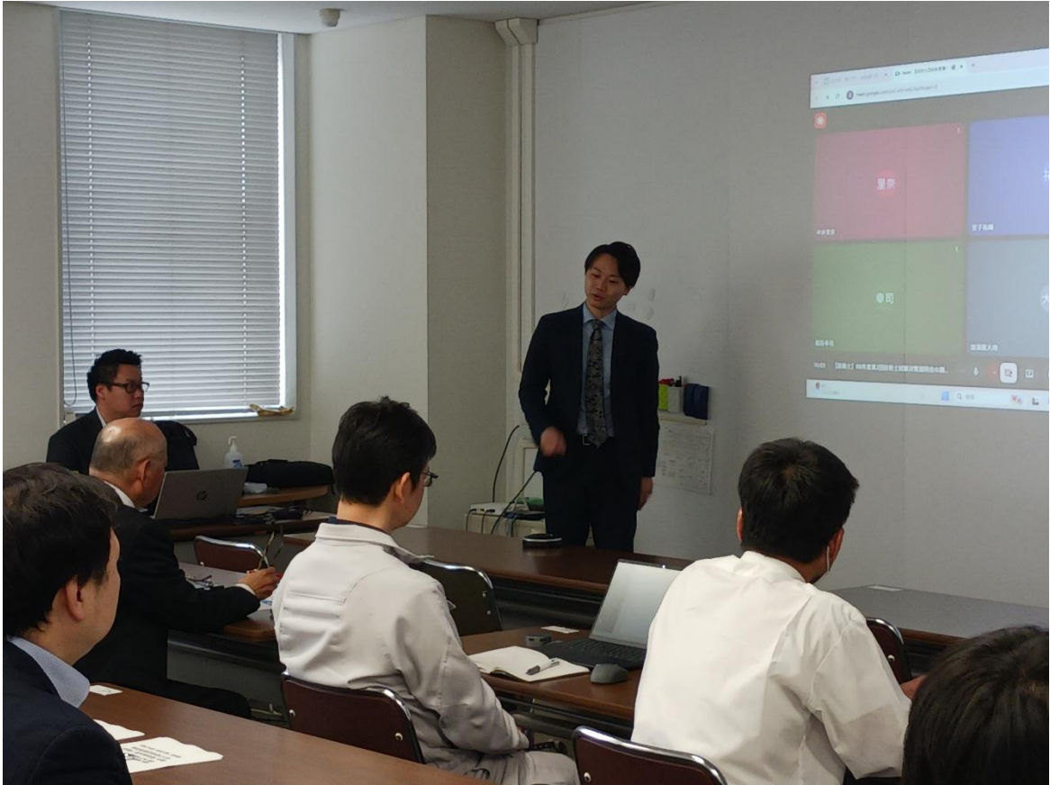
合格体験談を語る村副主任