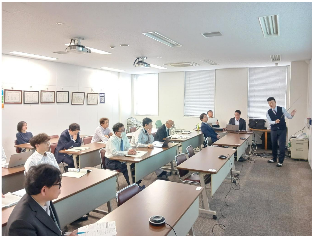
会議室で参加する受験対象者や指導者