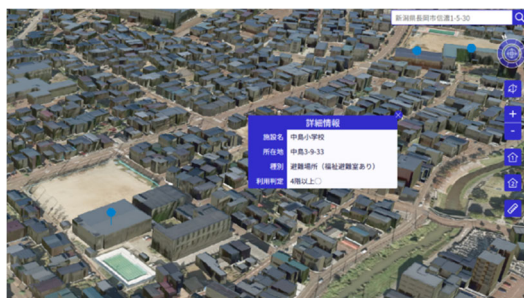
垂直避難可能な避難場所の情報の表示