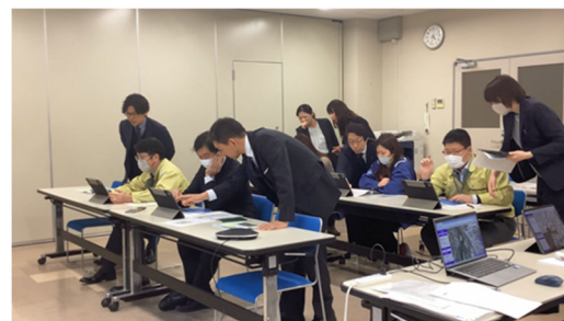
行政職員のツール操作の様子