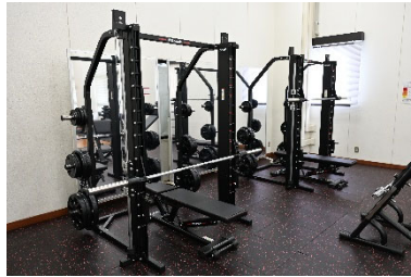
スミスマシン(新規導入)